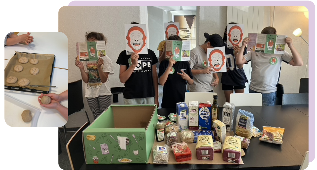
Palmöl-Kampagne: Gemeinsam palmölfrei frühstücken – und verstehen, warum das zählt.

Die Antwort haben wir nicht in Statistiken gefunden. Sondern in Momenten – und was aus ihnen folgt. Wenn ein Kind ein altes Smartphone zerlegt und plötzlich begreift, welche Schätze hinter dem Bildschirm stecken. Wenn die Jugendliche versteht, dass ihr Frühstück etwas mit dem Überleben von Orang-Utans zu tun hat. In der Stille im Saal, wenn ein Wissenschaftler erklärt, wie der Regenwald atmet – und zweihundert Augenpaare aufleuchten.