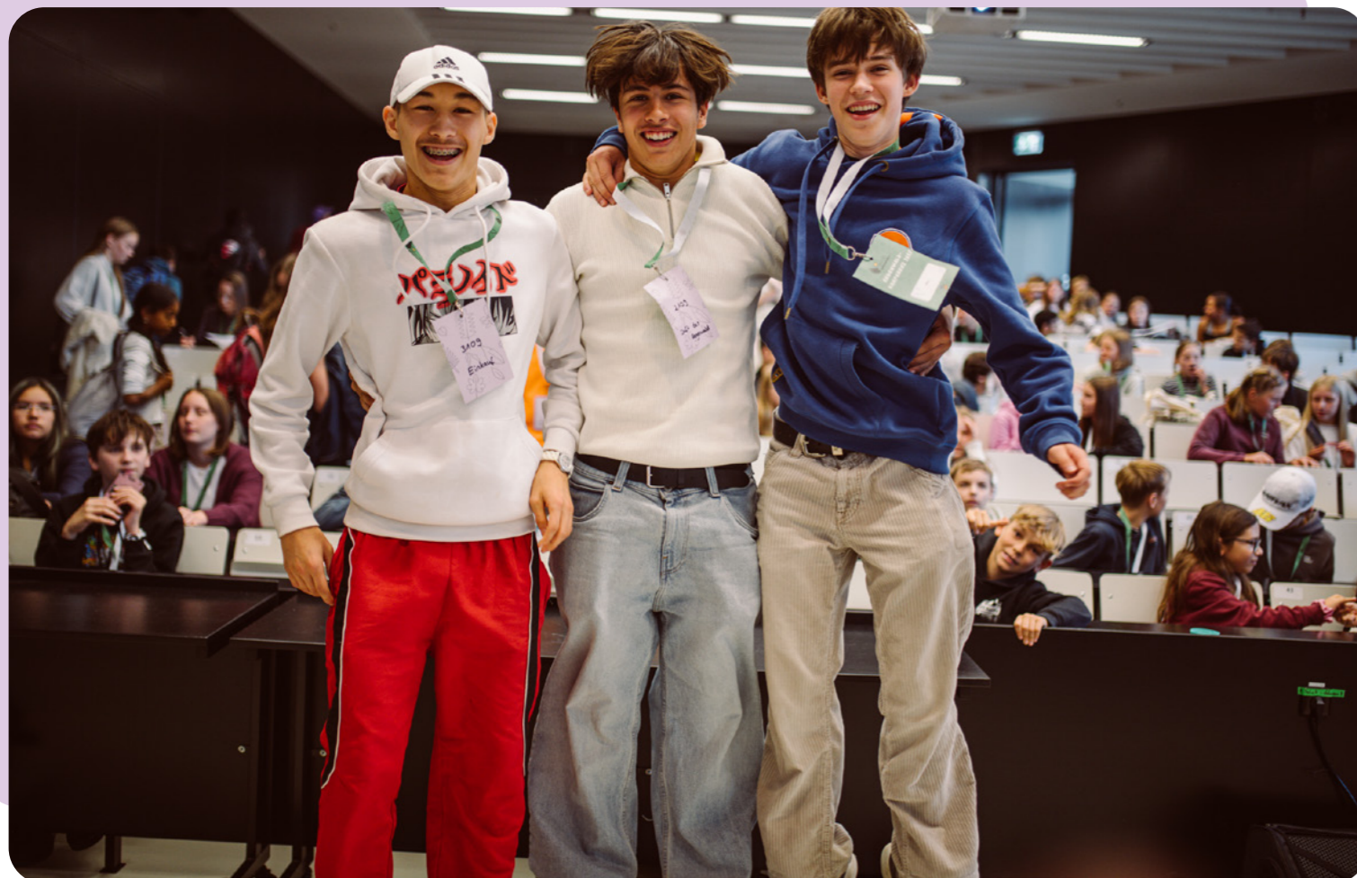
Zweite Regenwald-Konferenz: 180 Schüler:innen, Wissenschaft auf Augenhöhe – und ein Tag voller Aha-Momente.

Was ändert sich wirklich, wenn junge Menschen erleben, dass sie im Alltag den Regenwald schützen können – und dass ihr Handeln Wirkung hat?